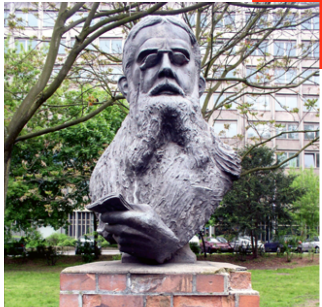
Denkmal von Franz Mehring am Franz-Mehring-Platz in Berlin-Friedrichshain.