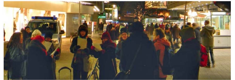
Mahnwache am 7. Dezember 2012 in der Innenstadt von Hannover

ladesch sind seit 2005 mindestens 600 Arbeiter/innen bei Fabrikbränden ums Leben gekommen. Deshalb haben lokale Gewerkschaften, die internationale Clean Clothes Campaign und andere Arbeitsrechtsorganisationen nach einer Lösung gesucht und im März 2012 mit PVH (Calvin Klein, Tommy Hilfinger) ein Brandschutzabkommen vereinbart. Über zwei Jahre sollen in beteiligten Fabriken umfassende Maßnahmen zur Arbeitssicherheit und zum Gesundheitsschutz aufgebaut und erprobt werden. Alle Beteiligten (Beschäftigte, Regierung, Fabrikbesitzer, Abnehmer, Gewerkschaften, Nichtregie-