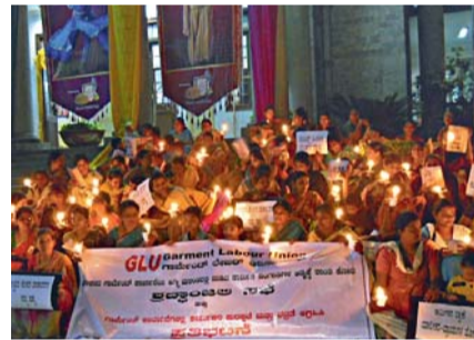
Mahnwache der Garment Labour Union in Bangalore, Indien

Unglücksfälle sind nichts Neues in der globalisierten Bekleidungsindustrie: Allein in Bang-