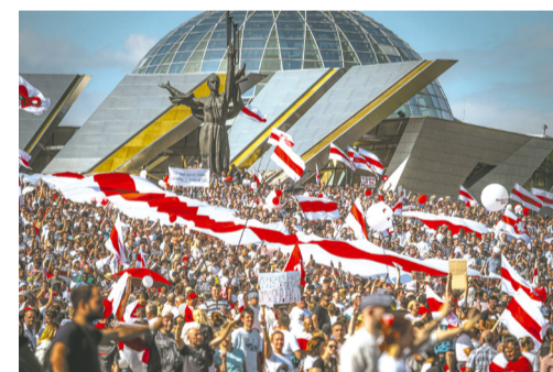
JANUN Hannover e. V.

Belarus, ein Land mit aktuell rund 1500 politischen Gefangenen. 850 Nichtregierungs-Organisationen – so gut wie alle gesellschaftskritischen und im weitesten Sinne politisch engagierten Vereine – wurden in den letzten drei Jahren verboten. Ungezählte Menschen haben ihre Arbeit verloren, insbesondere Lehrer*innen und Hochschuldozent*innen.